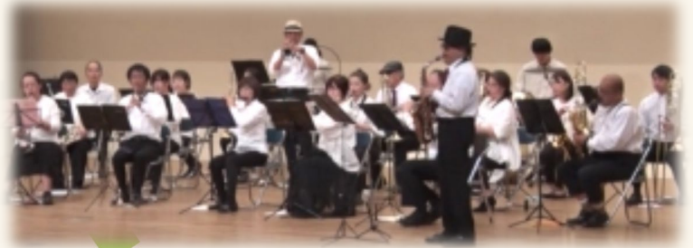
備前ブラスバンドクラブ