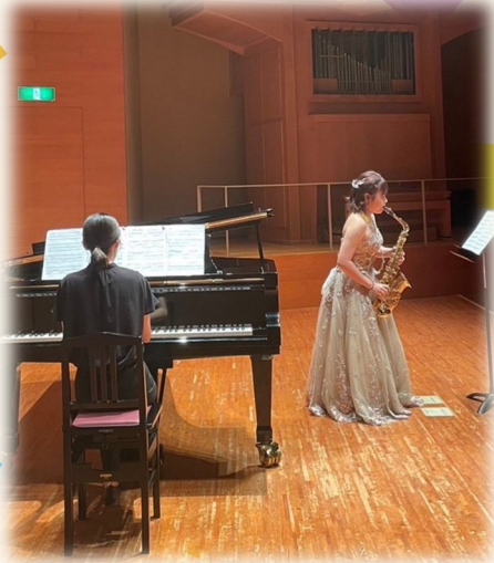
くらしき作陽大学の学生さん