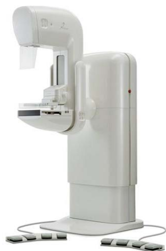
東芝製マンモグラフィー「Pe・ru・ru」